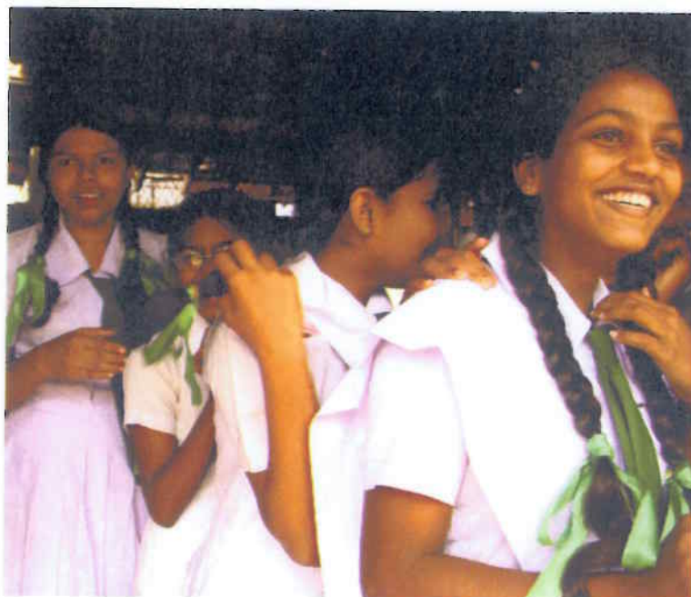
Das Lächeln ist zurück – Schülerinnen in Beruwala.