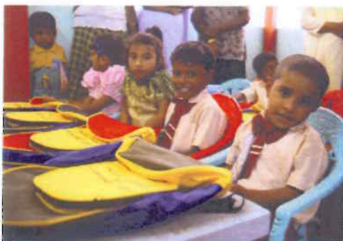
Kindergartenkinder in Hambantota an der Südküste.