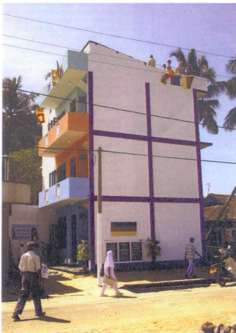
Ein Haus für drei Familien, die vorher obdachlos am Rand eines Abwasserkanals vegetierten.