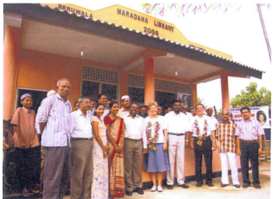
Bildungschancen für alle: Die neu errichtete Bücherei in Beruwala ist ein wichtiges Stück Kultur in der Küstenstadt. Die alte wurde von der Flut restlos zerstört.