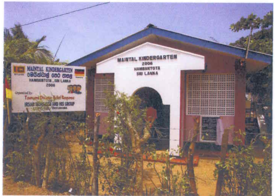
Top-Standard auf Sri Lanka: Der Maintal-Kindergarten strahlt Freundlichkeit aus.