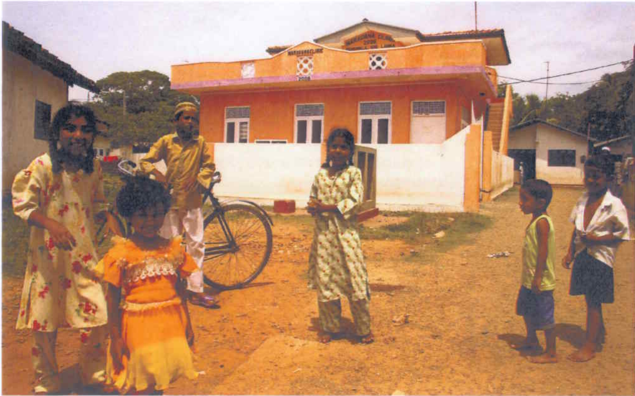
Die im Februar eröffnete Maradana-Klinik hat sich längst bewährt.