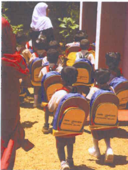
In Reih' und Glied: Kinder aus Hambantota auf dem Weg in den neuen Mainital-Kindergarten.