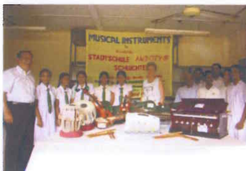
Musikinstrumente für den Schulunterricht gingen an mehrere Schulen und Kindergärten, ermöglicht von der Stadt und der Stadtschule Schlüchtern.