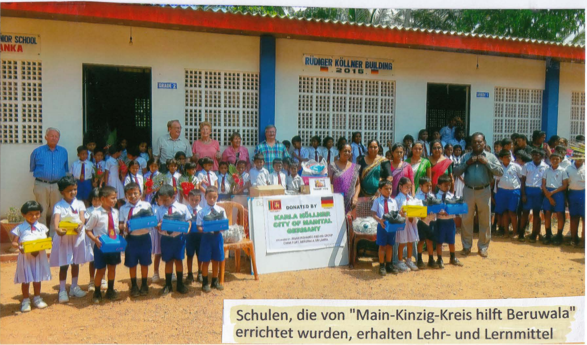
Schulen, die von "Main-Kinzig-Kreis hilft Beruwala" errichtet wurden, erhalten Lehr- und Lernmittel