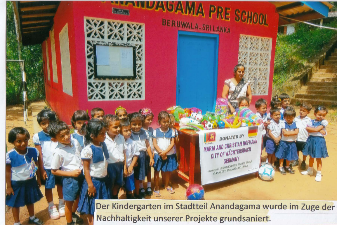
Der Kindergarten im Stadtteil Anadagama wurde im Zuge der Nachhaltigkeit unserer Projekte grundsaniert.