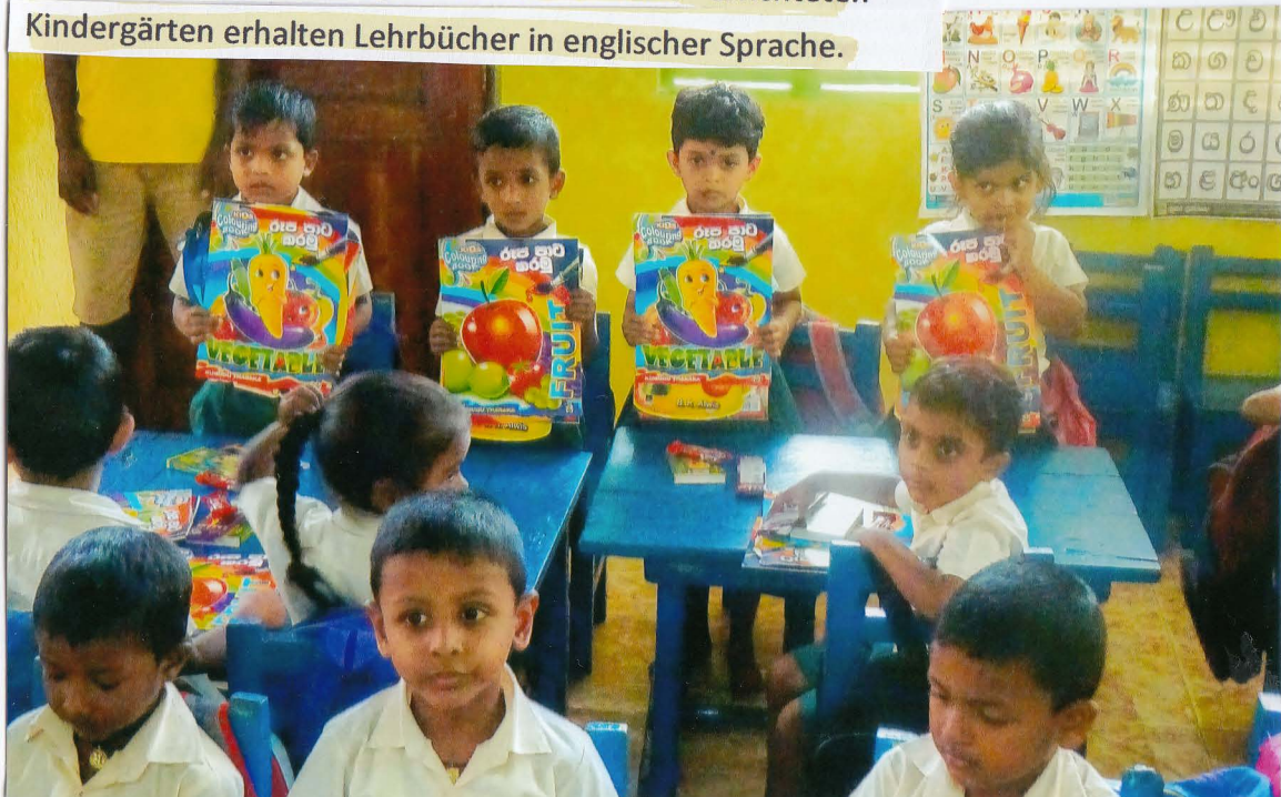
Die 13 von "Main-Kinzig-Kreis hilft Beruwala" errichteten Kindergärten erhalten Lehrbücher in englischer Sprache.