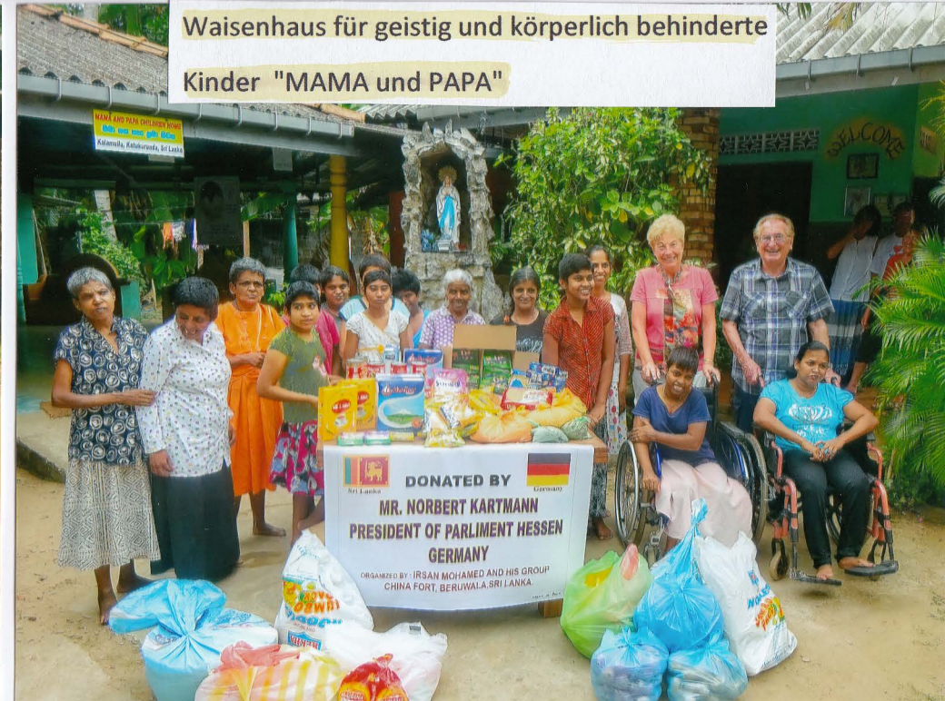
Waisenhaus für geistig und körperlich behinderte Kinder "MAMA und PAPA"