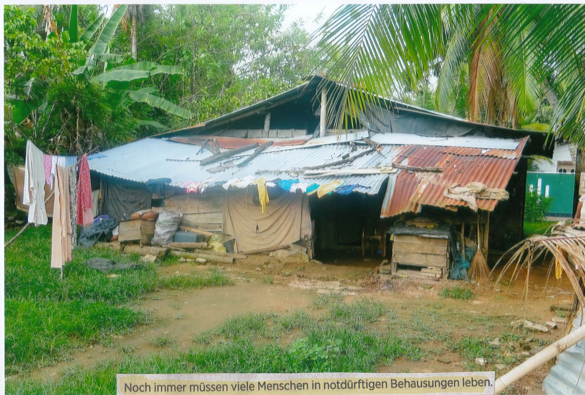
Noch immer müssen viele Menschen in notdürftigen Behausungen leben.

Frankfurter Allgemeine ZEITUNG FÜR DEUTSCHLAND