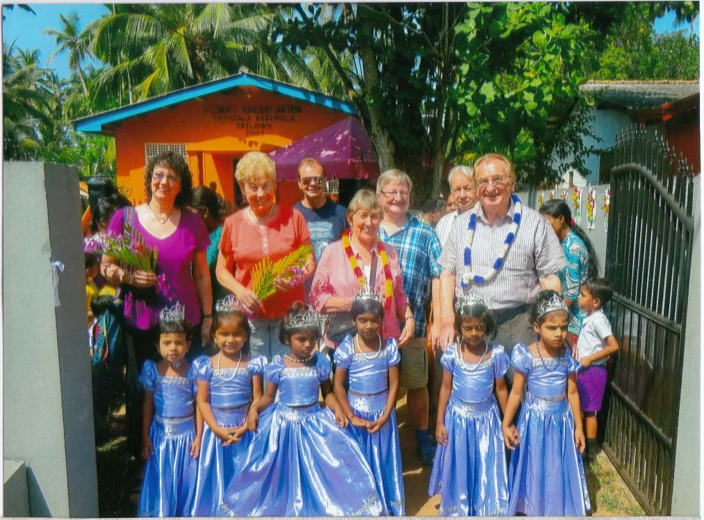
Seit zehn Jahren wachsen im inklusiven Kindergarten behinderte mit nicht behinderten Kindern auf. Als Dank für die Spenden, die den Bau seinerzeit möglich machten, wurde eine Feier für die Besuchergruppe veranstaltet.