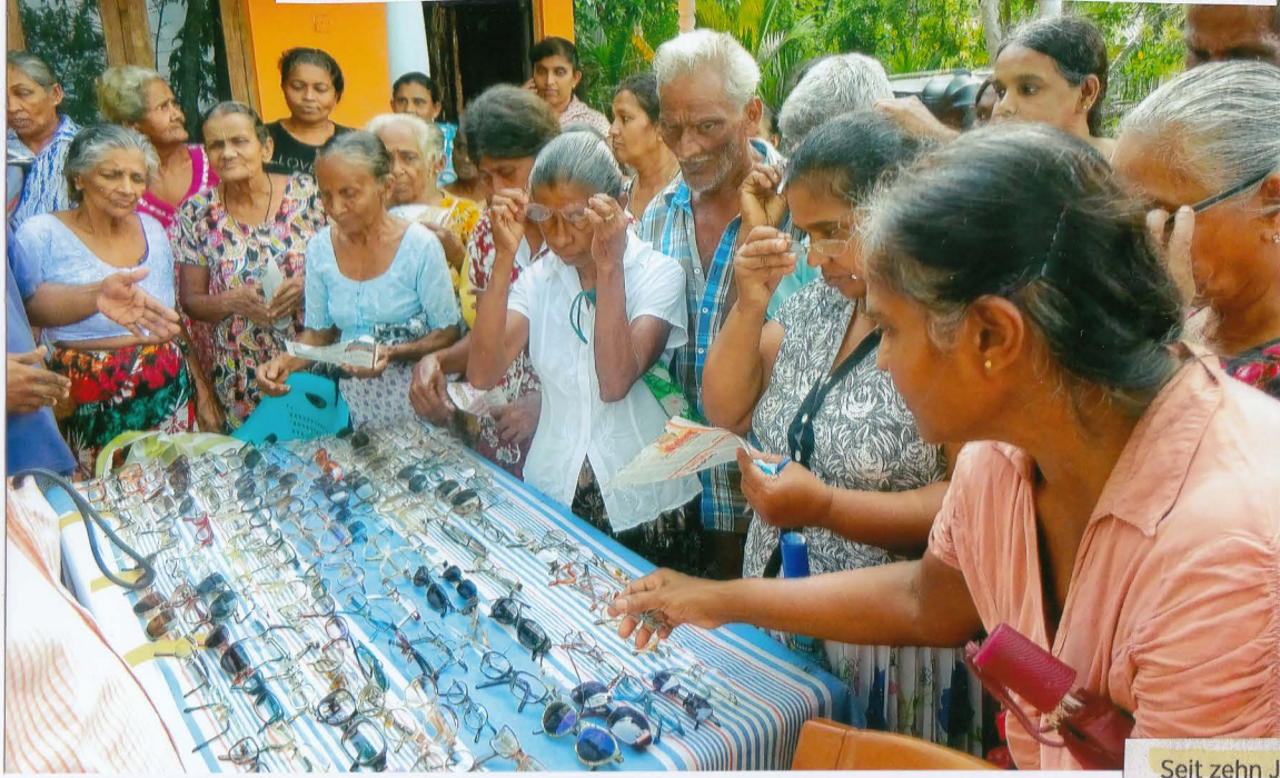
Mehr als 800 Brillen – allesamt Sachspenden aus dem Main-Kinzig-Kreis – fanden in Beruwala dankbare neue Besitzer. Der Andrang bei den Übergaben fiel wie immer sehr groß aus.