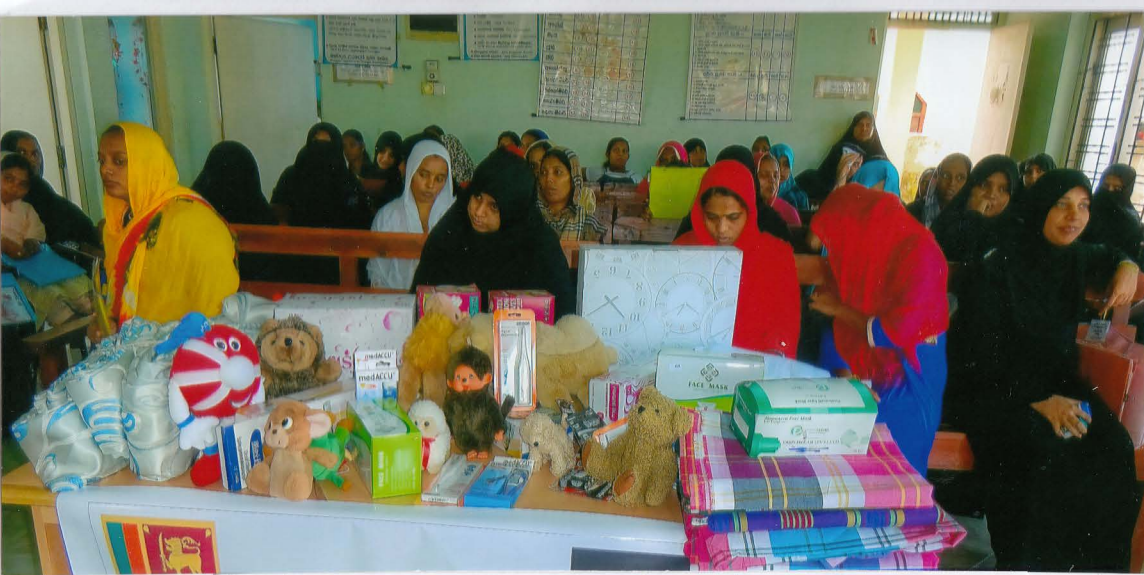
Der Warteraum der von "Main-Kinzig-Kreis hilft Beruwala" errichteten Frauenklinik im Stadtteil Maradana