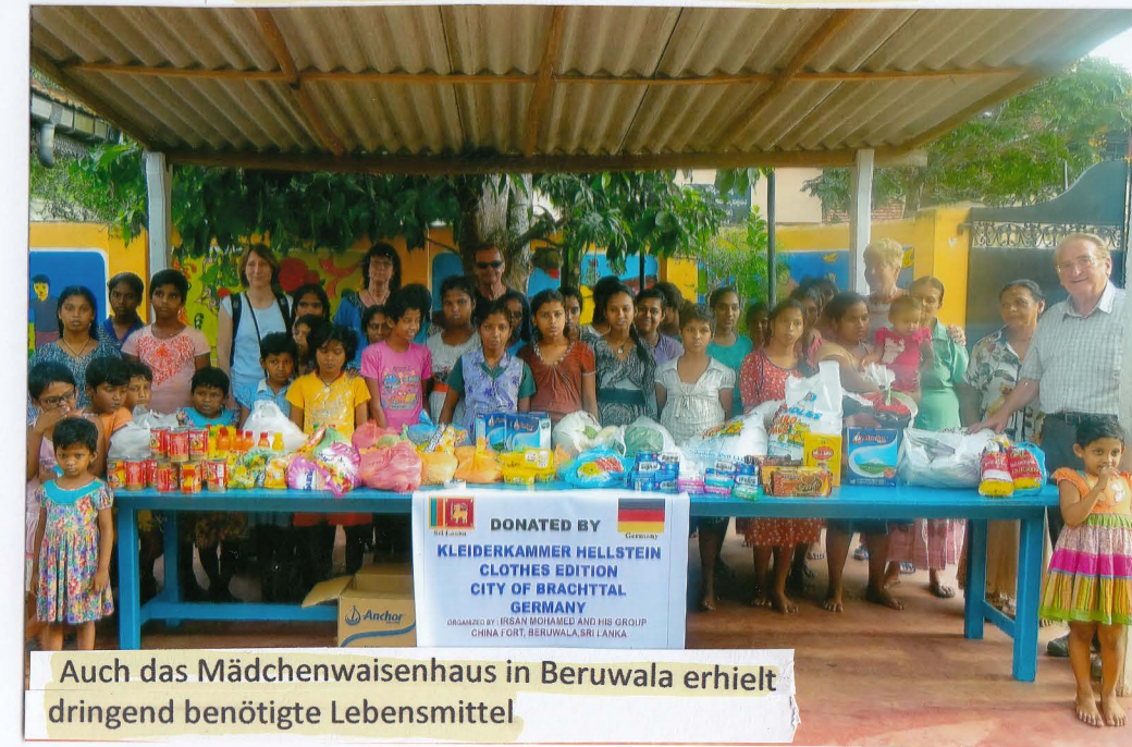
Auch das Mädchenwaisenhaus in Beruwala erhielt dringend benötigte Lebensmittel