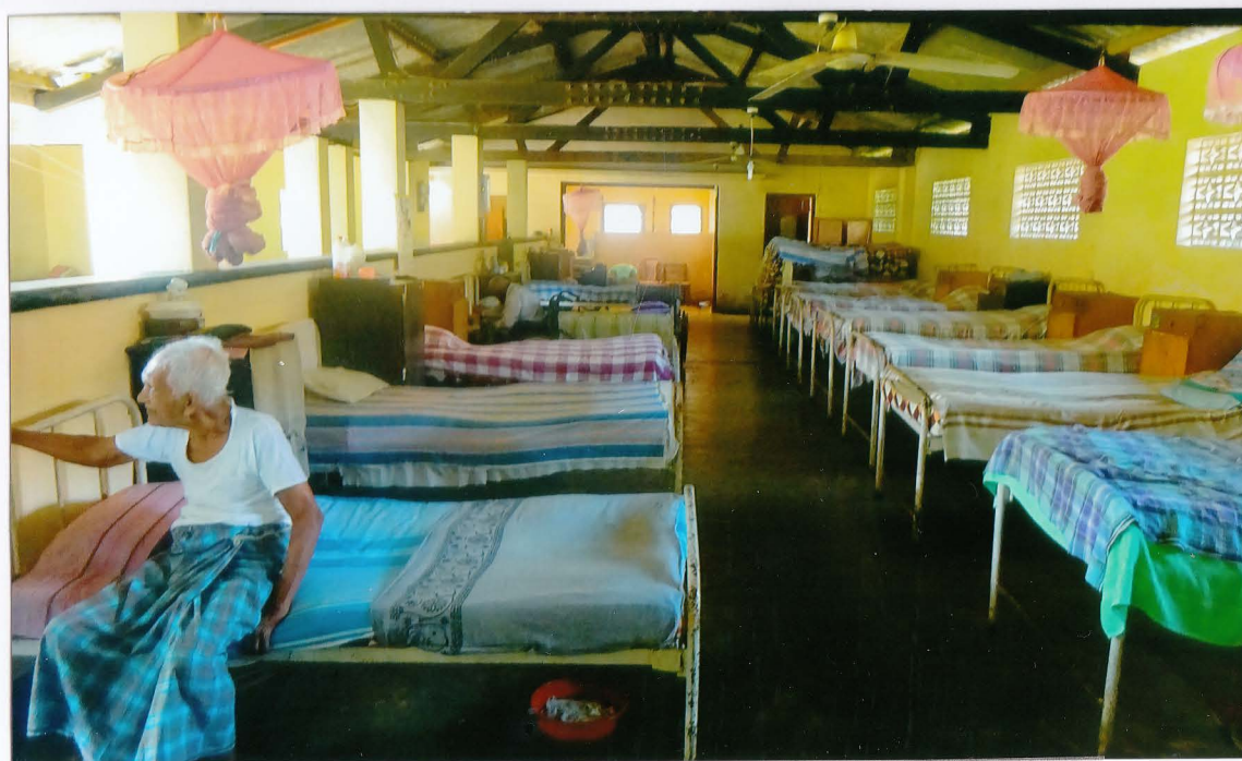
Bis zu 25 Personen müssen sich im Altenheim derzeit noch einen Schlafsaal teilen. Latrine und Waschräume sind an Unwürdigkeit nicht zu übertreffen.